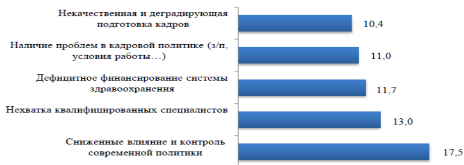
Рисунок 2.1 - Значимые проблемы развития системы здравоохранения в РФ, по данным Экспертно-аналитического центра РАНХиГС 10 .

3. Дефицитное финансирование системы здравоохранения (11,7%).