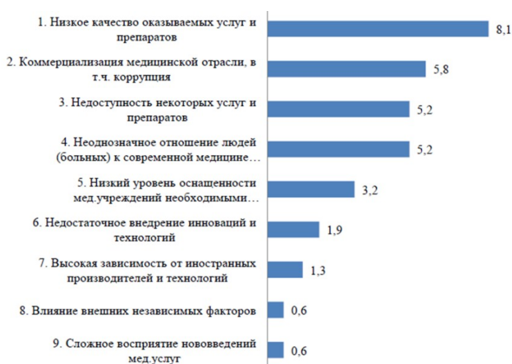
Рисунок 2.4 - Проблемные аспекты в системе здравоохранения, проценты 14 .

Экспертное сообщество также высказало следующие проблемные аспекты системы здравоохранения (рисунок 2.4.): Низкое качество услуг и лекарств (8.1), торговля в медицинской отрасли, включая коррупцию (5.8), отсутствие определенных медицинских услуг и услуг (5.2), неоднозначное отношение людей (пациентов) к современной медицине (неуважение и культура) (5.2), низкий уровень оснащения, медицинские учреждения располагают необходимым медицинским оборудованием (3.2), недостаточные инновации и технологии внедрения (1.9), высокая зависимость от иностранных производителей и технологий (1.3), влияние независимых аутсайдеров (0,6), сложные когнитивные инновации в медицинских услугах (0,6) 0,6), низкий спрос на медицинскую помощь (0,3) и неэффективное время ассигнования на оказание медицинских услуг (0,3)