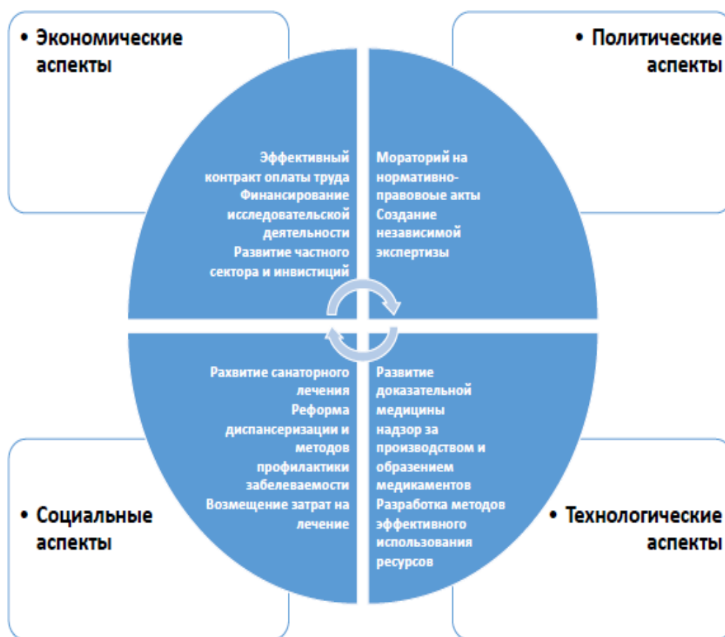
Рисунок 3.1- Направления развития социальной политики в области здравоохранения 21 .

привлечения специалистов из стран ближнего зарубежья. (рисунок 3.1.) 20