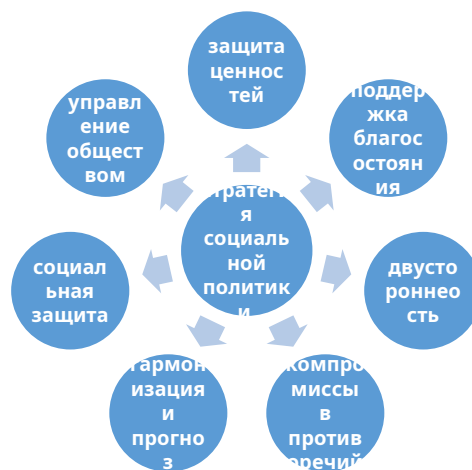
Рисунок 1.2– Классификация функций социальной политики

Классификация самых важных функций, которые представлены на схеме рисунка 1.2 4 .